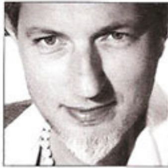
Marcel Wanders , niederländischer Designer, empfiehlt: