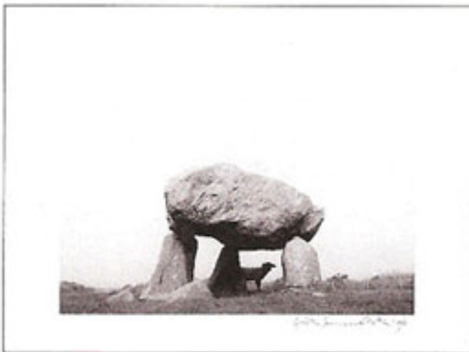
Pentti Sammallahti , Pentre Ifan, Wales 1996, schwarz weiß Fotografie, 25 x 30 cm