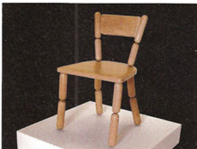
Freshwest , Lazy Chair, 2009, massive Eiche, 80 x 80 x 80 cm