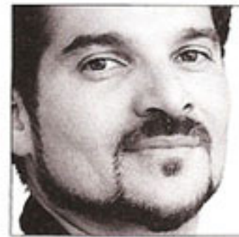
Der spanische Künstler und Designer Jaime Hayon ist begeistert von: